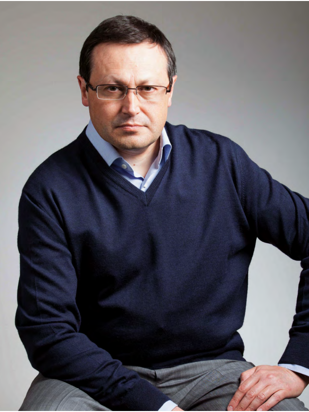
Эдхам Акбулатов ГЛАВА ГОРОДА КРАСНОЯРСКА