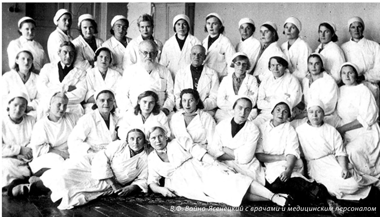
В.Ф. Войно-Ясенецкий с врачами и медицинским персоналом