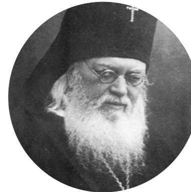
Архиепископ Лука (в миру Валентин Феликсович Войно- Ясенецкий)

епископ Русской Православной Церкви, с апреля 1946 года — архиепископ Симферопольский и Крымский, российский и советский хирург, ученый. В августе 2000 г. канонизирован Русской православной церковью в сонме новомучеников и исповедников Российских для общецерковного почитания