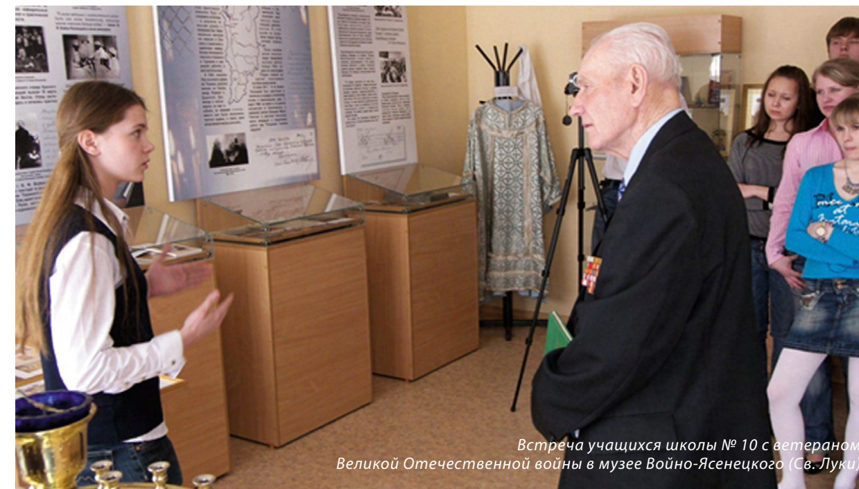
Встреча учащихся школы № 10 с ветераном Великой Отечественной войны в музее Войно-Ясенецкого (Св. Луки)