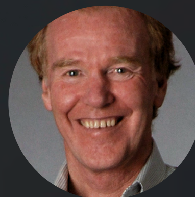
Питер Сенге (англ. Senge Peter )

В 1990 году Питер Сенге положил начало движению обучающихся организаций, опубликовав работу «Пятая дисциплина». В этой книге были изложены пять основных понятий, которые нужны организации и ее сотрудникам, чтобы стать обучающейся организацией. Публикуем небольшой фрагмент из его книги.